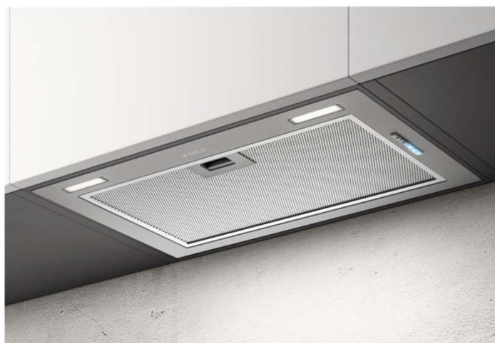
* Представленное изображение является 3D моделью и может не совпадать на 100% с оригинальным прибором