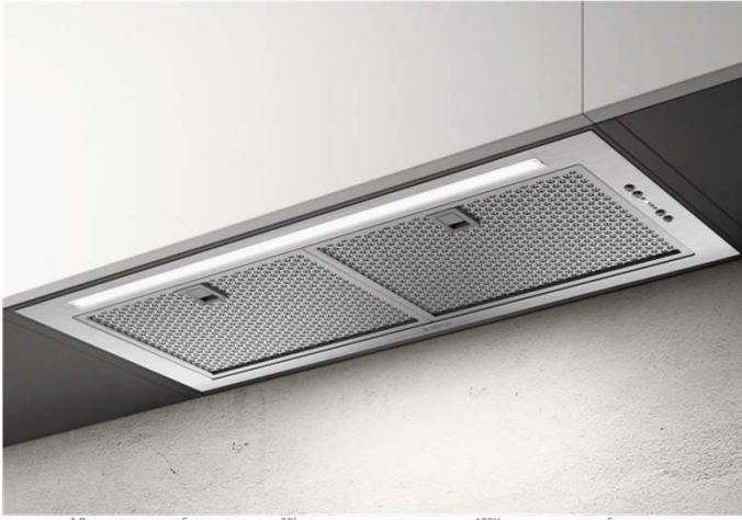
* Представленное изображение является 3D моделью и может не совпадать на 100% с оригинальным прибором